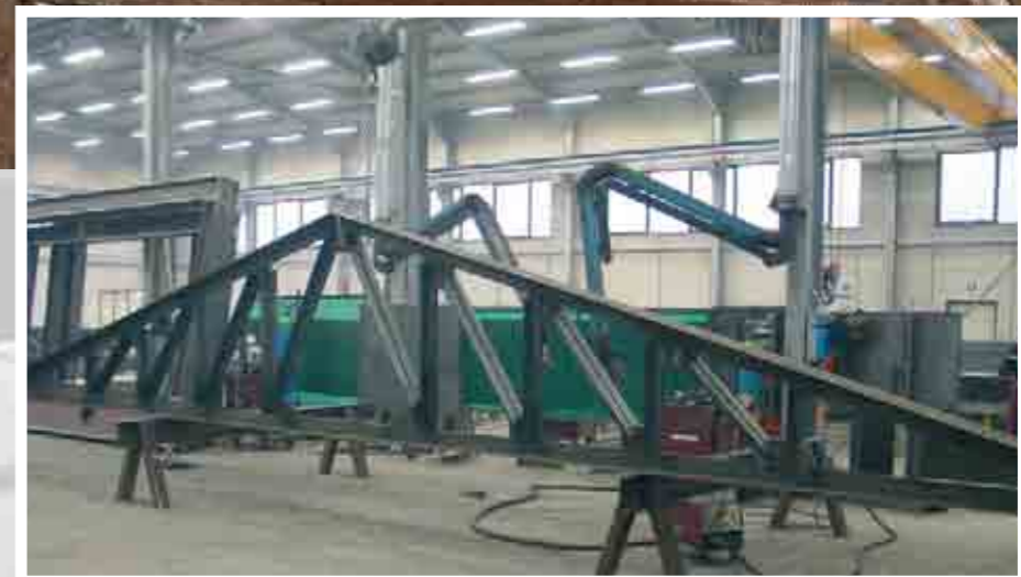
Museo della Memoria. Giardino Zucca, Bologna. Acciaio impiegato ton 105 Trave principale reticolare luce m 30 Coperture mq 1150